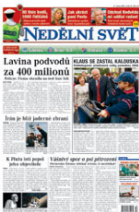
titulní strana (pdf)

rubriky Publicistika Na mušce Svět vědy Scéna Auto & Moto Cestování Bydlení Menu Zdraví Společnost